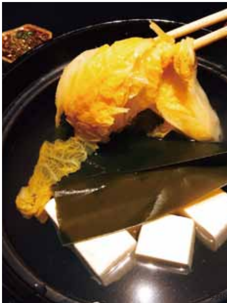
湯豆腐 1人前 780円(税別) ※2人前〜注文

昆布などの出汁でいただく湯豆腐は、シンプルだからこそ本物の味!湯豆腐の為に作られたなめらかな豆腐を使用し、甘みととろみの強い富里産の「オレンジ白菜」と一緒に。そして、ネギをたっぷり使い二手間三手間かけて作った特製のネギダレ。これが絶妙にマッチして絶対にやみつき!必ずまた食べたくなる味だ。