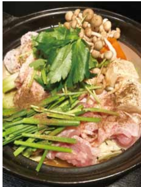
しびれ鍋 2人前 2,800円 3人前 4,200円(税別)

山椒が効いた、なんとも言えない美味しさ さわやかな香りと心地良い刺激の『しびれ鍋』