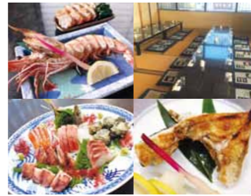
5ページ MAP 9

ブリッブリの大エビ塩焼き、マグロステーキ、カマ焼き、蛤酒蒸しなど、酒の肴も充実。活気あるカウンターや落ち着いた個室で楽しもう。