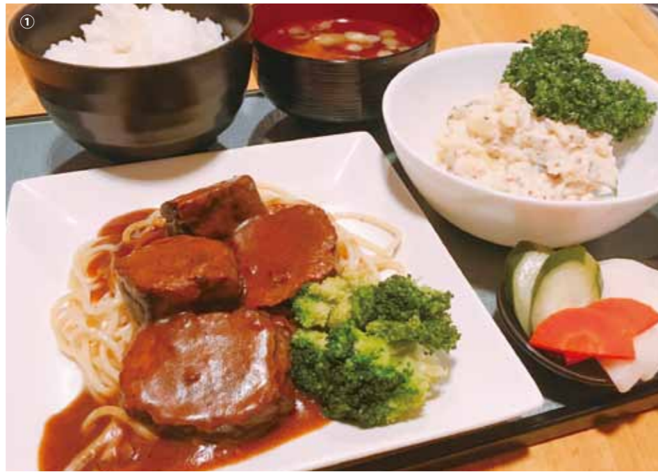
ビーフシチュー定食 800円 ごはん・みそ汁・漬物・小鉢付き

成田周辺の穴場をガンガン掘り起こすべく突撃! こんな身近にあったんだっていう驚きのネタ捜索中。空振り三振しながらも、ヒット&ランを狙っちゃよみんなからの投稿も待ってるね〜(詳しくは28P)