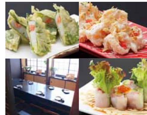
5ページ MAP 6

参道からちよつと入った所...分かつづらい場所にある穴場的なお店だ。少人数から利用できる個室でゆっくり、大切な人と飲み交わそう。