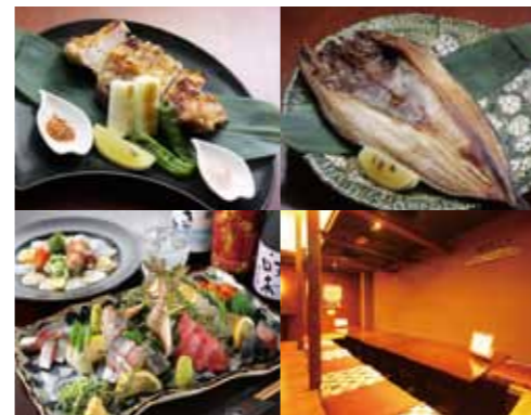
5ページ MAP 8

本日の焼き魚880円〜、刺身盛り合わせ3点盛り1,200円〜。国産鶏焼き(タレ/塩)700円、牛タン塩焼き1,200円等、魚系以外のつまみも揃う。