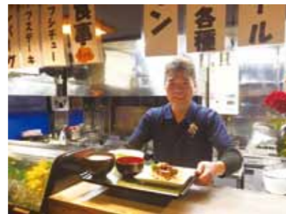
店主のとこちいん

定食以外の食事、つまみメニューも充実のラインナップ。ナポリタン(⑤)、やきそば、マカロニグラタンは全て500円。380円のおつまみメニューも多数→ちくわ磯辺、カキフライ、激辛麻婆、豚玉葱串揚げ、春巻、揚焼売、ポテトフライ等