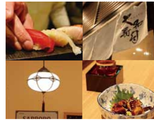
5ページ MAP 2

寿司屋といっても飾らない雰囲気なので、仕事帰りぶらっと寄りたりハシゴでの気軽な「一杯」にも使える。