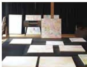
家屋にはアート作品が並ぶ