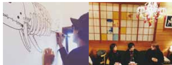
カフェ店内には美術館で観る作品のアーティストたちが隣の席に。アーティストがオーナーならはのカフェ。

「おしゃれ!」アートカフェ TOAST AND HONEY について教えてください。JR成田線下総松崎駅から徒歩30秒の場所にあるアートとコーヒーのアートカフェです。ここは長い間使われていなかったうどん屋を解体等でのリノベーションは行わず、その場所に残る歴史を紐解き、その場所にコンセプトを持たせコンバートさせる(用途を換える)。眠っていた場所を目的の場所を再生することです。ここで集まる場として発信しています。