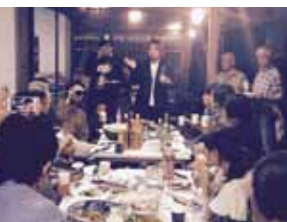
国内外で活躍するアーティストが滞在し、地域の人たちと交流を深めながら作品を制作していく