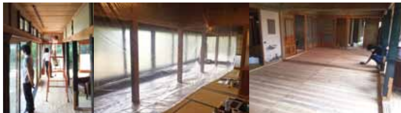
空き家の日本家屋を新しい拠点に。シムラウスケによる設計、施工。現代的な空間へと換わる。(上の写真へ)