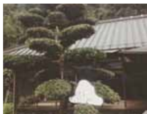
一般宿泊、イベント使用も可能 *要アポイント