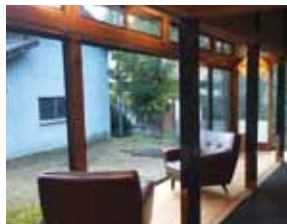
現代的な空間と縁側が交わる