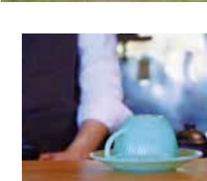
食器はファイヤーキングが並ぶ

「おしゃれ!」アートカフェ TOAST AND HONEY について教えてください。JR成田線下総松崎駅から徒歩30秒の場所にあるアートとコーヒーのアートカフェです。ここは長い間使われていなかったうどん屋を解体等でのリノベーションは行わず、その場所に残る歴史を紐解き、その場所にコンセプトを持たせコンバートさせる(用途を換える)。眠っていた場所を目的の場所を再生することです。ここで集まる場として発信しています。