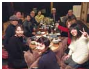
国内外で活躍するアーティストが滞在し、地域の人たちと交流を深めながら作品を制作していく