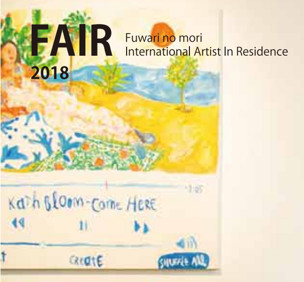
here (2018) - rita, Spain