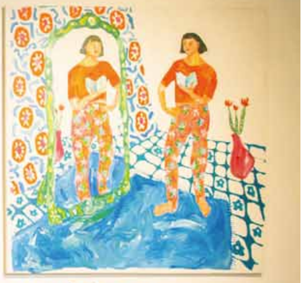
me, talking to myself (2018)